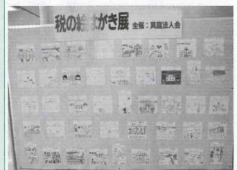
税の絵はがき展の様子