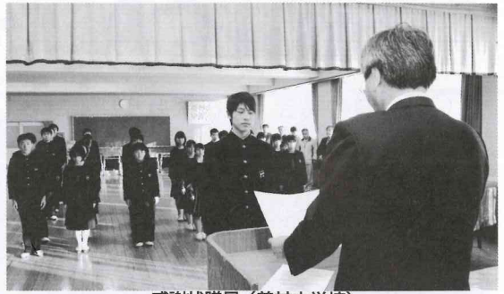
感謝状贈呈 (美甘中学校)

真庭法人会の主催で行われた「税に関する絵はがきコンクール」には、久世税務署管内の小学六年生から多数の作品が寄せられ、審査の結果、次の方々が入選されました。